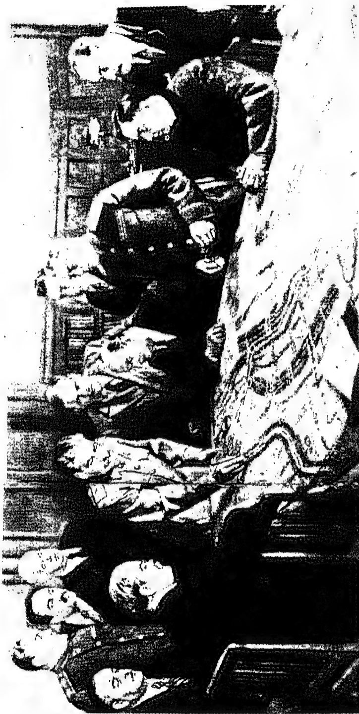
ستالين قائد مكتبي: كان ستالين يحب فرش الخرائط العسكرية على الطاولة الكبيرة في مكتبه لمتابعة سير المعارك. ويرى من حوله كبار القادة والمسؤولين.